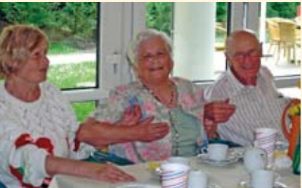
Zusammen feiern macht Freude

Wir freuen uns, Ihnen auch in diesem Jahr ein vielfältiges Programm an Veranstaltungen und Aktivitäten präsentieren zu können. Auf den folgenden Seiten finden Sie Näheres zu Terminen und der Art der Veranstaltung.